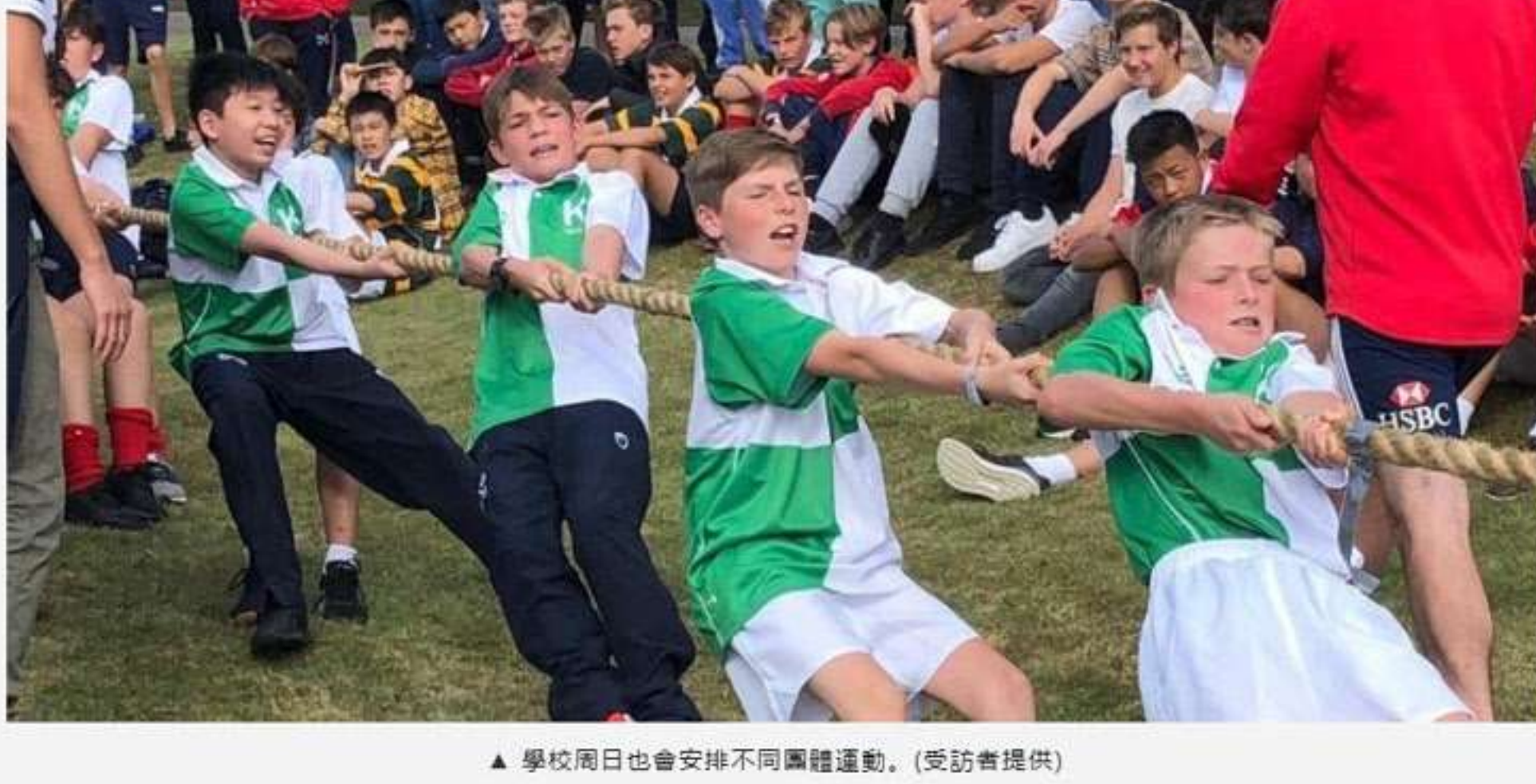
▲ 學校周日也會安排不同團體運動。(受訪者提供)