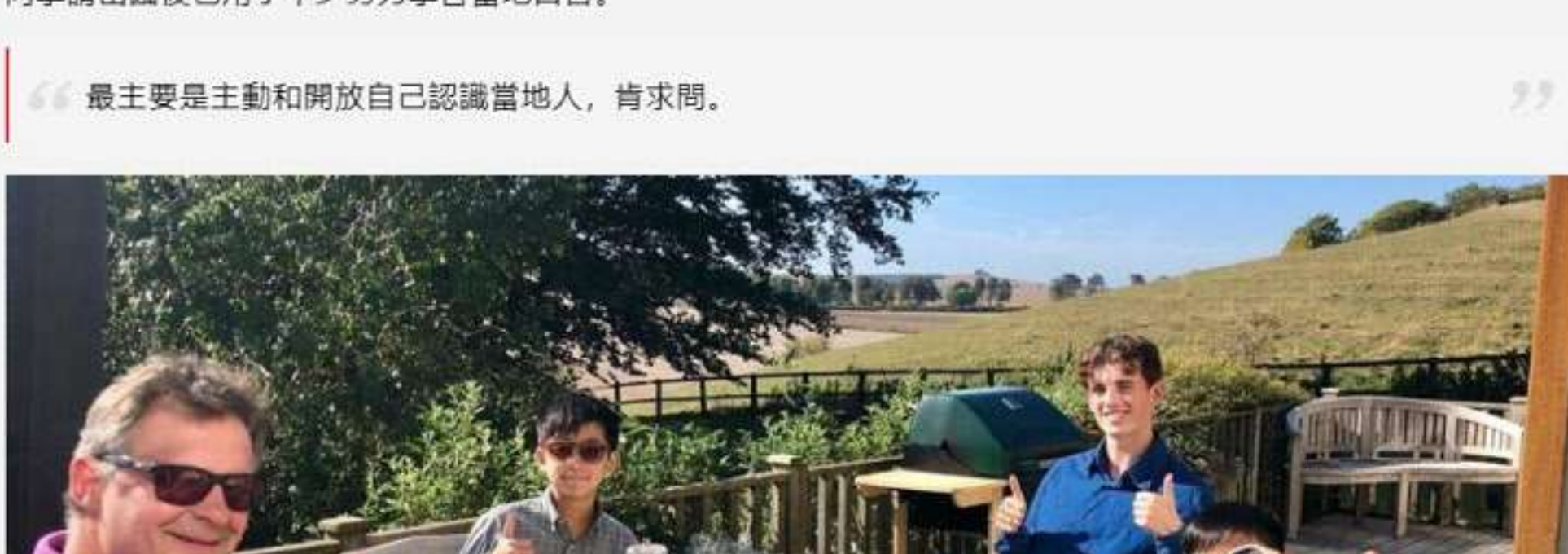
▲ 學校安排香港師兄跟他分享校內生活。(受訪者提供)