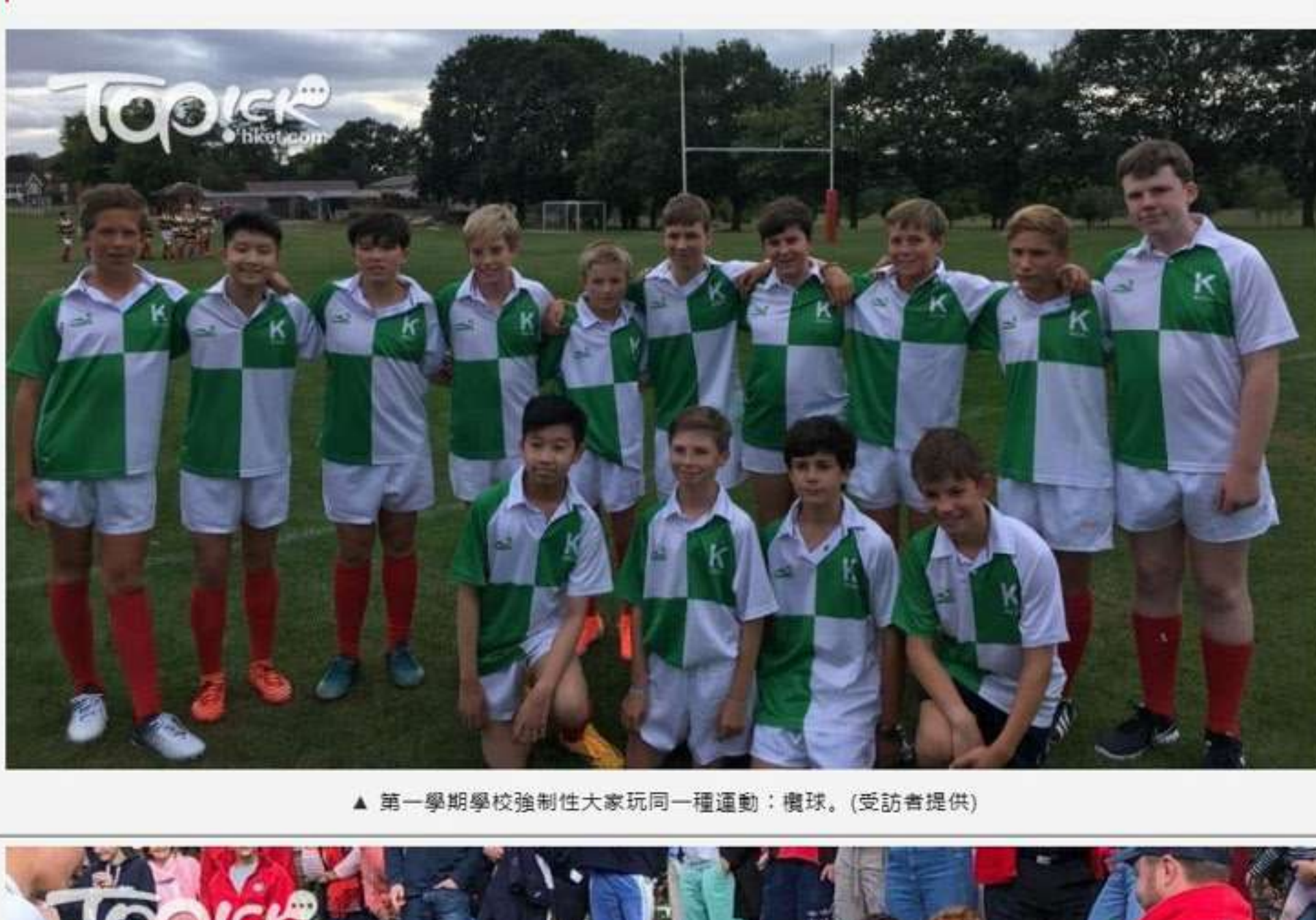
▲ 第一學期學校強制性大家玩同一種運動：壘球。