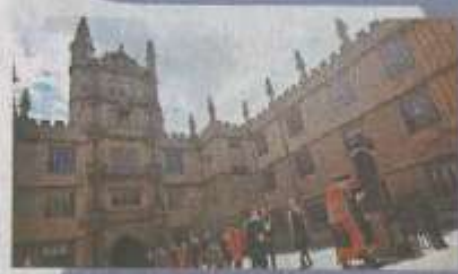
牛津(上)及劍橋大學的面試出名難捉摸,考生們要好好準備。