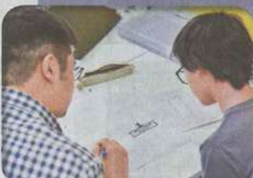
為成功考入心儀大學,不少學生會找導師一對一跟進和準備。