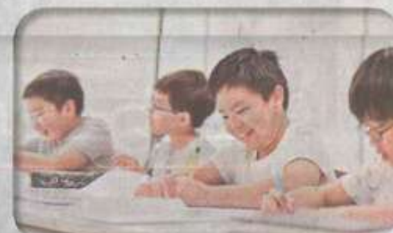
年紀小的學生未需要為考大學費神,保持他們的學習熱情是家長的首要任務。